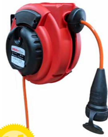
NOUVEAU Enrouleur avec unité Slowmotion compatibilité S-kompatibel