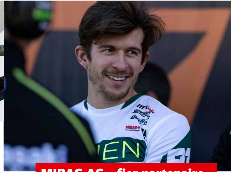
MIBAG AG – fier partenaire de JEREMY SEEWER!

MIBAG AG Systèmes d'énergie CH-8833 Samstagern